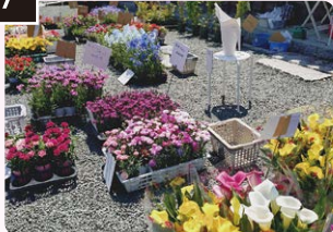
7 鉢植え花の展示販売会