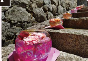
1 ガラスポウルフラワー